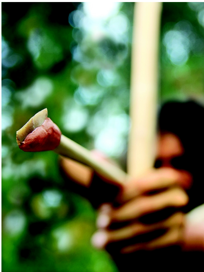
Fi. 1. Un cacciatore con arco e frecce. Le analisi condotte sulle semilune di Grotta del Cavallo (Nardò, Lecce), datate tra 45.000 e 40.000 anni fa, indicano che l'uomo moderno immanicava questi piccoli oggetti in pietra su un'asta lignea che poi scagliava meccanicamente con un arco o un propulsore.